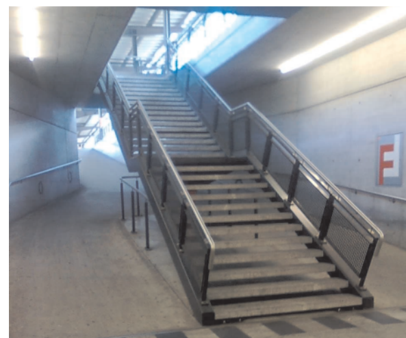
Das Bild zeigt Treppe und dahinter liegende Rampe von der Unterführung aus. Die oberen Ausgänge liegen am Bahnsteig hintereinander, dadurch ist zwischen Ausgang und Bahnsteigkante viel Platz. (Bahnhof Chur)